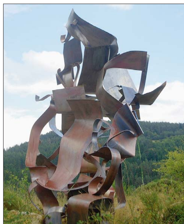
Les entreprises confient régulièrement des matériaux à Gustav Schubotz qui leur offre une nouvelle vie

Un échange constructif avec les anciens industriels