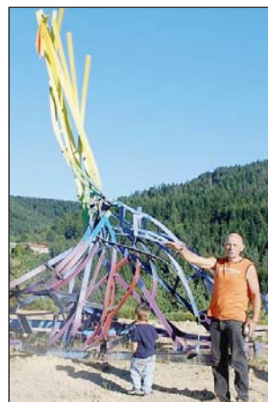
La Voie verte est en contrebas du parc

Et l'idée de baliser un accès menant de la Voie verte au parc de sculptures fait son bonhomme de chemin. « Ce projet est au stade de la réflexion. Il reste à imaginer des solutions pour sécuriser la traversée de la route. Ce petit détour s'inscrirait très naturellement dans le prolongement de la balade et il présenterait un double intérêt. Il permettrait d'abord aux promeneurs de découvrir le parc dont on aperçoit quelques sculptures